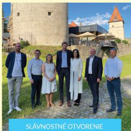
SLÁVNOSTNÉ OTVORENIE projektu v Bardejove