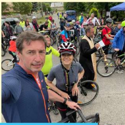
CYKLOJAZDA S KDH z Juskovej Vole cez Slanské vrchy