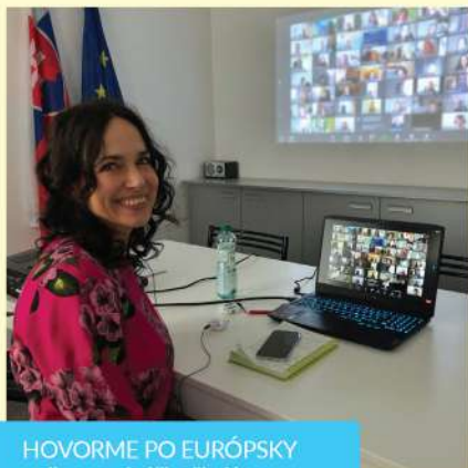
HOVORME PO EURÓPSKY online prednášky školám