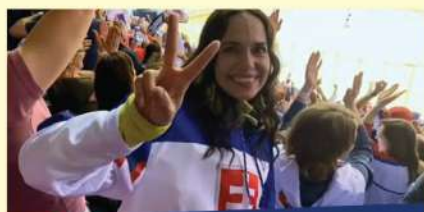
PRE NAŠICH HOKEJISTOV