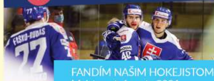
FANDÍM NAŠIM HOKEJISTOM Majstrovstvá sveta 2021