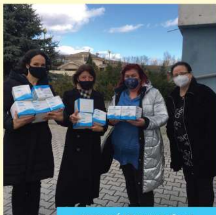
RESPIRÁTORY K ĽUĎOM pomoc seniorom v pandémie