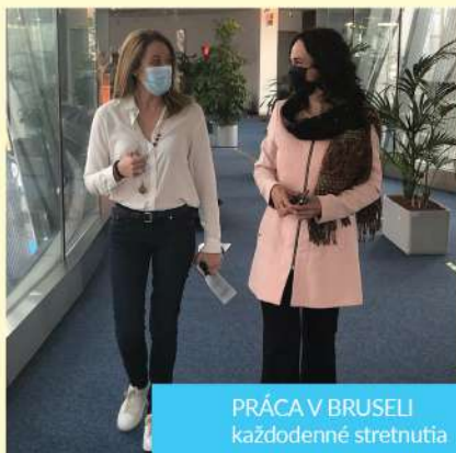
PRÁCA V BRUSELI každodenné stretnutia