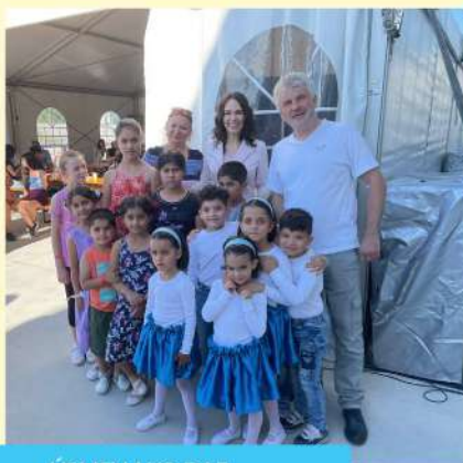
ÚSMEV AKO DAR Najmilší koncert roka