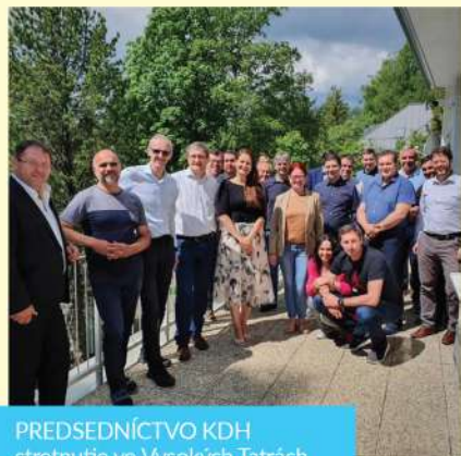
PREDSEDNÍCTVO KDH stretnutie vo Vysokých Tatrách