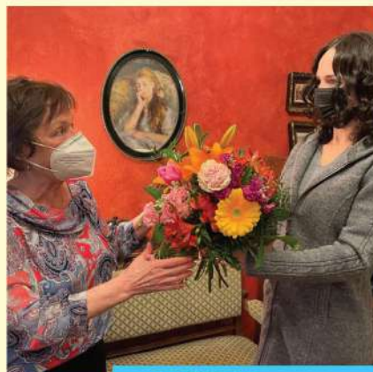
DEŇ MATIEK nezabudla som ani na tú svoju